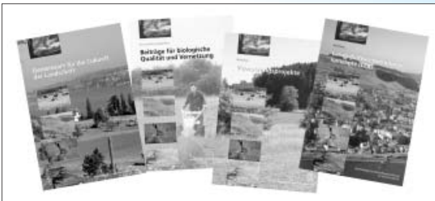
Neue Publikationen zum Thema «Nachhaltige Landschaftsentwicklung im Kanton Zürich».

Urs Kuhn Fachstelle Naturschutz Amt für Landschaft und Natur Neumühlequai 10 Telefon 043 259 43 64 Telefax 043 259 51 90 E-Mail: urs.kuhn@vd.zh.ch