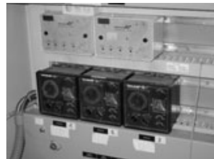
Reduktion des Wärmeverbrauchs durch optimal eingestellte Heizungsregler: Nachtabsenkung erhöhen, Heizkurven anpassen, Heizgrenzen mit Aussentemperatur koppeln, etc.

Bei einem Spital mit 100 Betten fallen bei einem Abonnement «Abo Plus» jährliche Kosten von rund CHF 3 500 für den Gebäudebetreiber an. In diesen Kosten inbegriffen sind ca. vier Ing.-Tage pro Jahr. Das Spital hat etwa CHF 145 000 jährliche Energiekosten. Somit sind die Abonnementsprämien ab einer Energiekosteneinsparung von 3,1 Prozent amortisiert.