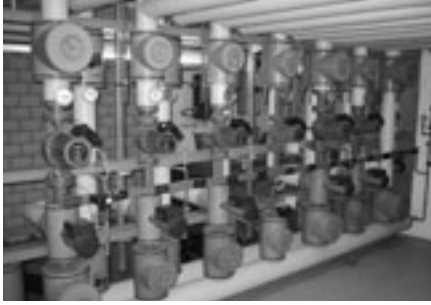
Reduktion des Wärmeverbrauchs bei der Wärmeverteilung: Pumpenleistung reduzieren, elektrische Begleitheizung optimieren, Verteilnetz optimal isolieren, etc.