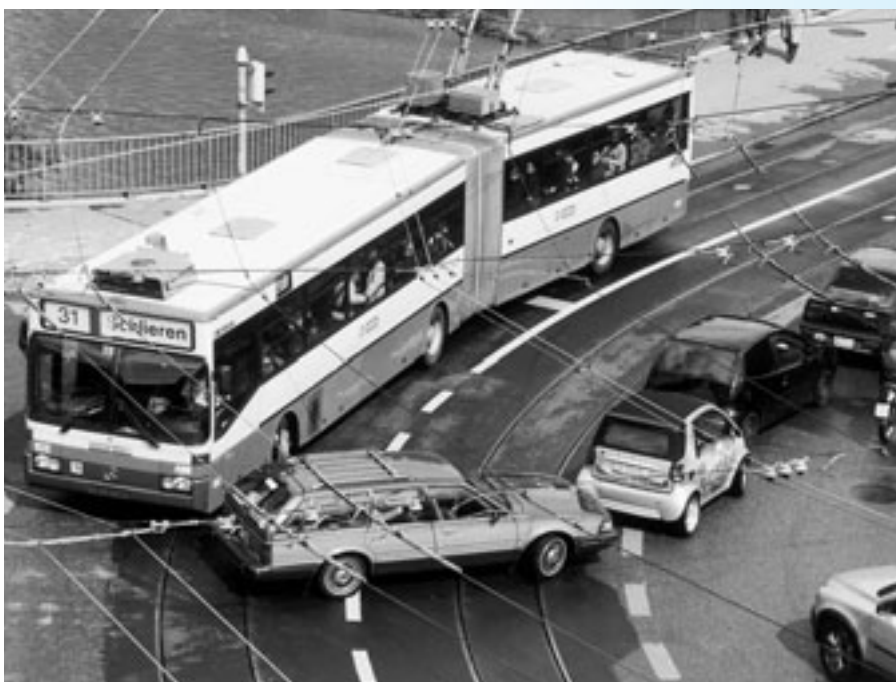
Verkehrsüberlastung während der Hauptverkehrszeit.