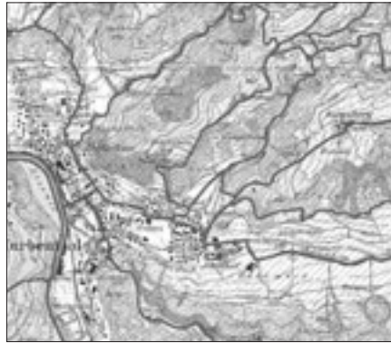
Karte Planungsgrundlagen.

Die Karte Planungsgrundlagen zeigt in einem Gesamtüberblick, welche rechtsgültigen Grundlagen bei der Waldbewirtschaftung zu beachten sind: