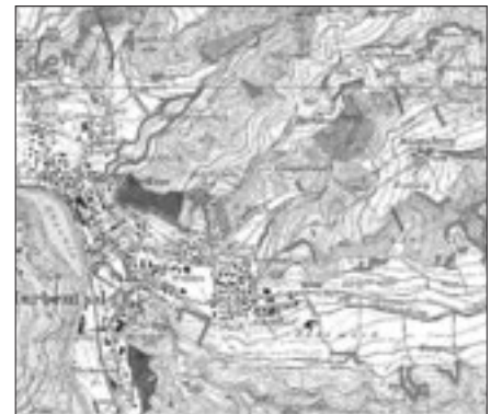
Zu den speziellen Objekten eines WEP können Reitwege, Rastplätze, Naturwaldreservate oder Ruheazonen für Wildtiere gehören. Quelle: Abt. Wald

In einer weiteren Karte werden spezielle Objekte bezeichnet, für die innerhalb des Planungszeitraums von rund 15 Jahren ein Handlungs- oder Koordinationsbedarf besteht. In den zu den einzelnen Flächen gehörenden Objektblättern werden Ziele und Massnahmen, die bei der Umsetzung beteiligten Stellen und die vorgesehenen Umsetzungsschritte bezeichnet.