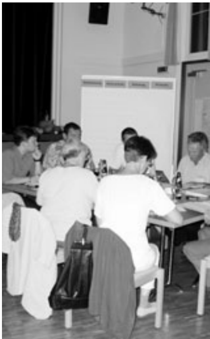
Bei der Waldentwicklungsplanung wird mit der Beteiligung aller Interessengruppen ernst gemacht (siehe Interview Seite 26).

Der Waldentwicklungsplan hingegen befasst sich hauptsächlich mit der Koordination und räumlichen Zuordnung der unterschiedlichen Zielsetzungen im Wald aus Sicht der Öffentlichkeit und hat damit Richtplancharakter. Der Waldentwicklungsplan umschreibt die Ziele und die Rahmenbedingungen für die Waldnutzung und bezeichnet Gebiete in denen spezielle Massnahmen erforderlich sind. Auf die Mitwirkung von am Wald interessierten Nutzergruppen wird grossen Wert gelegt. Als behördenverbindlicher Plan über die ganze Waldfläche schliesst er eine Lücke, die bisher zwischen der forstlichen Planung und der Raumplanung bestand.