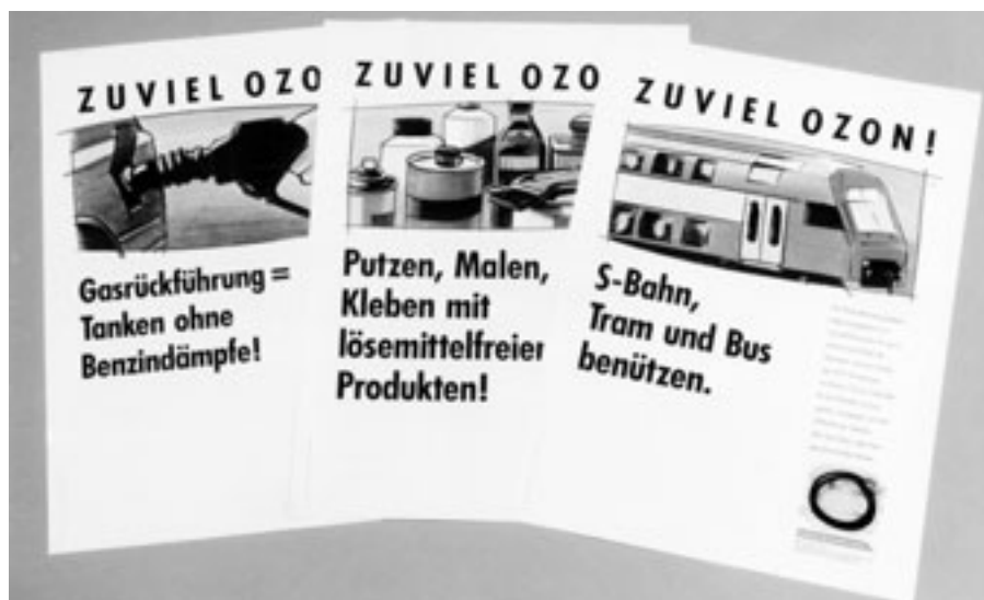
Die Ozonkampagne wurde in den Neunzigerjahren in enger Zusammenarbeit der Kantone, Gemeinden und Wirtschaftsverbänden lanciert.