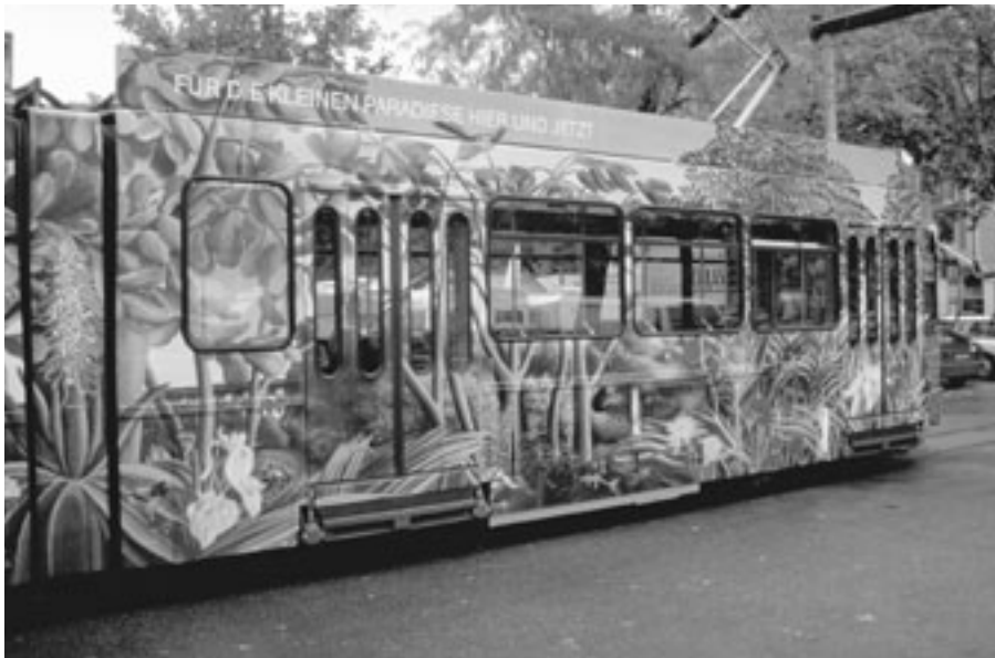
Mit dem Naturschutztram brachte die Fachstelle Naturschutz die Natur in die Zürcher City.

Die Erfahrungen der Abfallkampagne zeigen aber auch Grenzen der Kommunikationsarbeit auf. Nach Ablauf der Kampagne verschwand die vertiefte Auseinandersetzung mit dem Thema «Abfall» schnell aus der öffentlichen Diskussion. Ausnahme bildeten Einzelaspekte wie die Gebührenfrage oder ausgewählte Recyclingfragen. Auch engagierte Gemeinden pflegten die Kommunikation zum Recycling weiter. Innert weniger Jahre war man jedoch wieder auf einem Bewusstseinsniveau weit vor der Abfallkampagne angelangt. So müssen einfache Dinge wie das «Littering» wieder neu