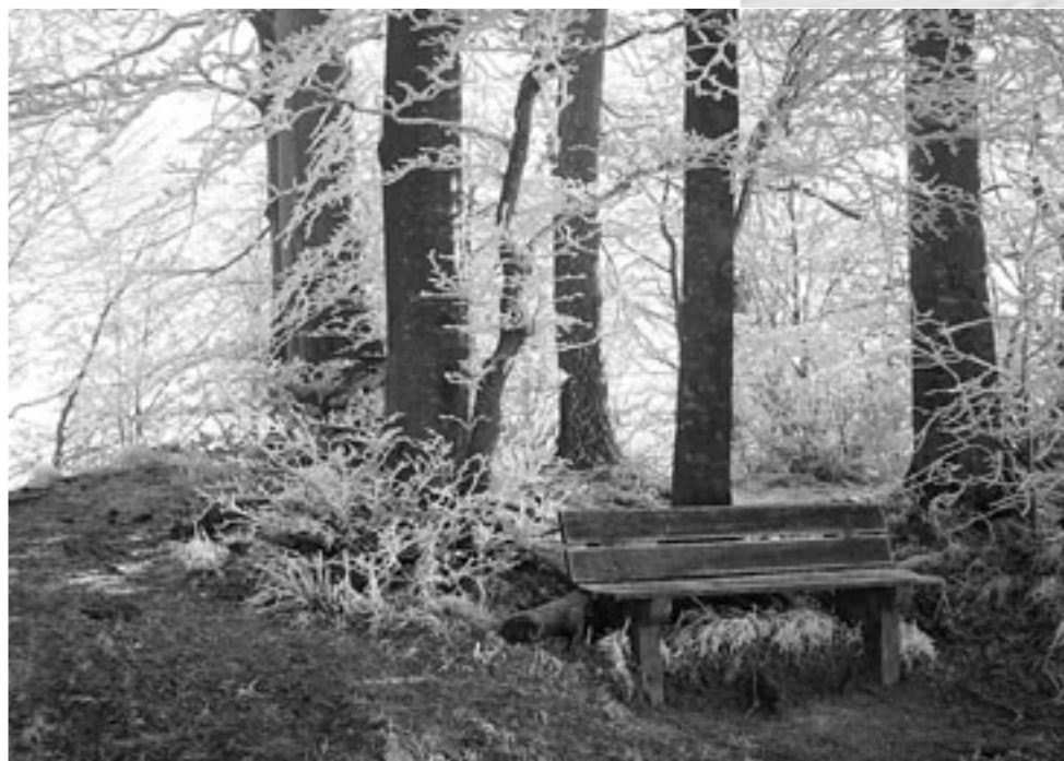
Mit Raureif angemalt

Bemerkung in eigener Sache: Fotos zur Umwelt im Kanton Zürich sind auch ausserhalb des Wettbewerbs jederzeit herzlich willkommen.