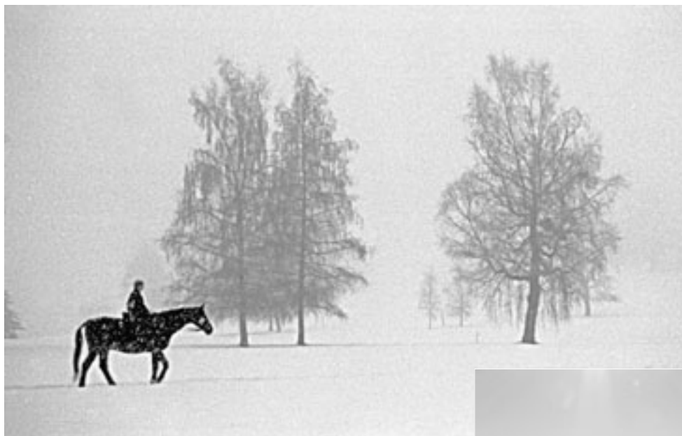
Unterwegs im Schneetreiben Winter in der Forch