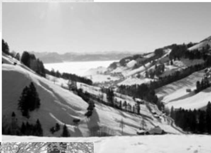
Über dem Nebel Goldinger Tal in Richtung Linthebene