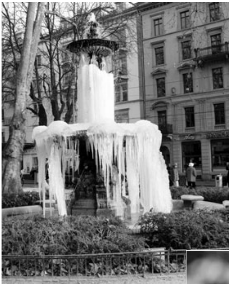
Eiszeit am Bahnhof Stadelhofen Zürich Stadelhofen