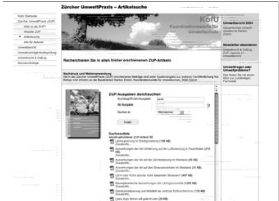
Überarbeiteter Auftritt der «Zürcher UmweltPraxis». Suche nach Beiträgen zum Thema Lärm. Quelle: KofU

Wer gezielter suchen möchte, kann bereits bei der Auswahl der Stichworte statt nach «Lärm» spezifisch nach «Lärmmessungen», «Lärmschutz» oder z.B. «Nachtlärm» suchen. Das Anklicken der Adresse führt dann direkt auf die entsprechende Webpage mit weiterführenden Informationen. Eine Artikelsuche bei der «Zürcher UmweltPraxis» unter dem Stichwort «Lärm» führt zu einer Flut von 60 Artikeln. Der Suchbegriff «Verkehrslärm» dagegen ergibt fünf verkehrsbezogene Beiträge, zum Beispiel zum Übersichtskataster, zu Sanierungen, aber auch zu Lärmwirkungen von Verkehrskreiseln. Unter der Rubrik « Bewilligungen und Gesetze » (Umweltrecht und Vollzug → Planungs-, Bau- und Umweltgesetze) gelangen Sie zu Volltext und Chronolo-