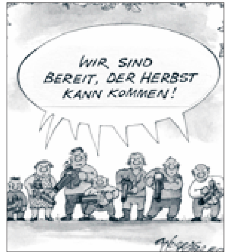
Illustration: Andreas Locher

Der Kanton Zürich hatte sich im Rahmen der Vernehmlassung anfangs Jahr positiv zur MaLV geäussert. Seiner Ansicht nach trägt sie zum Schutz des Wohlbefindens der Bevölkerung bei und vermeidet überdies technische Handelshemmnisse gegenüber der EU. In der kürzlich erfolgten Antwort auf die kantonsrätliche Motion hat er nun ausserdem festgehalten: «...Angesichts des geringen Anteils von Schadstoffemissionen durch Laubbläser, des grossen Interesses von Kanton und Gemeinden am Einsatz dieser Geräte und des wirtschaftlichen Interesses der Anbietenden ist ein Anwendungsverbot für Laubbläser aus Gründen der Verhältnismässigkeit abzulehnen. Zur vorsorglichen Verminderung der Luft- und Lärmbelastung ist der Kanton jedoch weiterhin darauf bedacht, Laubbläser nur einzusetzen, wo es zweckmässig und notwendig ist... Bezüglich Lärmschutz ist ergänzend darauf hinzuweisen, dass am 1. Juli 2007 eine Verordnung des Bundes in Kraft treten wird, die den Lärmschutz vor Geräten und Maschinen im Freien,