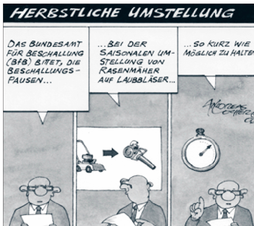
Illustration: Andreas Locher