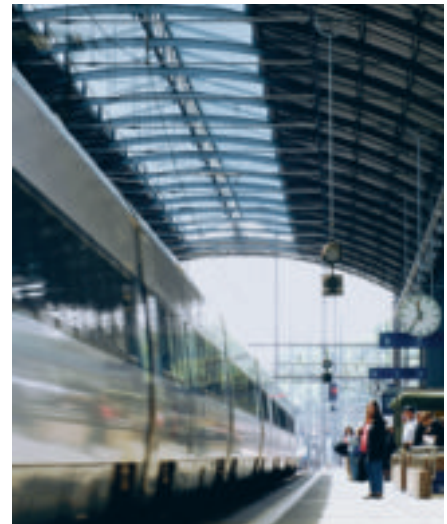
Der Infrastrukturausbau der Bahn sorgt für immer kürzere Reisezeiten.

Nehmen die variablen Kosten für die Benützung des Autos hingegen erheblich zu, so könnte es durchaus sein, dass ein Umsteigen, eine Substitution im engeren Sinne stattfindet, weil dadurch das Mobilitätsbudget konstant gehalten wird. Zu sagen ist allerdings,