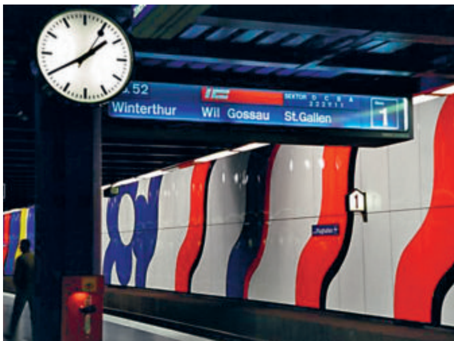
Die Erschliessung mit dem öffentlichen Verkehr wurde seit Jahren kontinuierlich verbessert. Die Reisezeiten haben sich verkürzt.