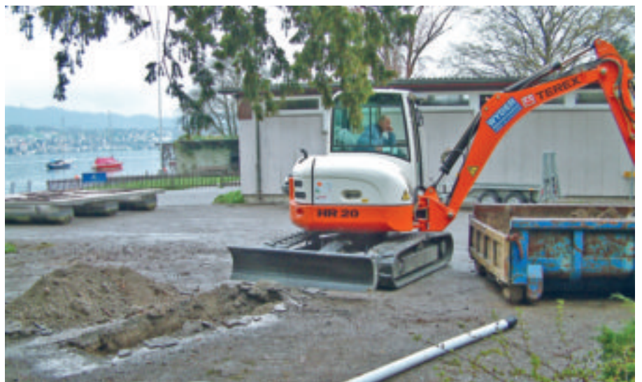
Erste Erkundung der Seeuferauffüllung Widen mit einem Baggerschlitz.

In dieser letzten, von 1960 bis 1977 betriebenen Gemeinde-Kehrichtdeponie wurden neben Kehricht und Sperrgut auch Abfälle lokaler Industriebetriebe abgelagert. Die Deponie wurde wie damals üblich ohne spezielle Vorkehrungen in einer Geländemulde errichtet. Im Untergrund ist ein dichtes Drainagenetz vorhanden, das in den Kriegsjahren zur Verbesserung des versumpften Wieslandes angelegt worden ist. Sickerwasser von der bis fünf Meter mächtigen und rund 12 000 m 3 umfassenden Deponie gelangt über diese