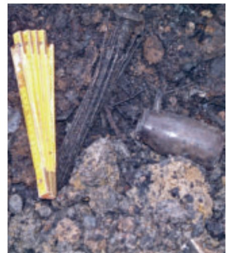
Der Deponieinhalt besteht zum grossen Teil aus verbrannten Abfällen. Im Bild: Knirps, Jogurtglas und Blech.

In Erlenbach liegen drei alte Gemeinde-Deponien, die von der Behörde aufgrund ihres Inhaltes und ihrer Lage als