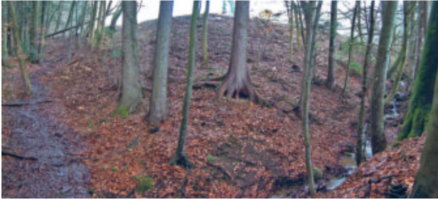
Deponiesickerwasser (linker Bildrand) gelangt in den nahen Müslibach.