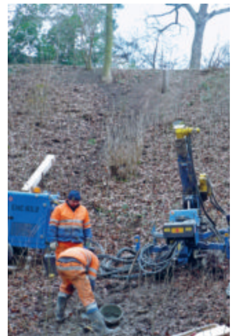
Abtiefen einer Bohrung am Fuss der Deponie Rossbächli mit anschliessendem Ausbau als Sickerwassermessstelle.