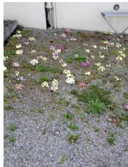
Ungestörter Bewuchs am Wildbach (links) und Spontanvegetation mit verwilderten Primeln und dem seltenen Kleinen Fingerkraut (rechts).