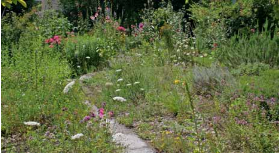
Dieser blütenreiche Naturgarten im Quartier beherbergt zahlreiche Insekten und andere Tiere.

Im Wald der Psychiatrischen Universitätsklinik wächst einsam ein Exemplar des Breitblättrigen Pfaffenhütchens. Diese Strauchart hat hier ihr einziges, wahrscheinlich natürliches Vorkommen in der Stadt Zürich und ist darum besonders schützenswert. Manch weitere botanische Besonderheit lässt sich anfügen: Vom dekorativen Tüpfelfarn am Wildbach über die Pflirsichblättrige Glockenblume und die Rauhaarige Nelke in einem alten Park bis zum unauffälligen Behaarten Bruchkraut, welches aus Pflasterfugen spriesst. All diesen Besonderheiten ist gemeinsam, dass sie nur sehr lokal vorkommen. Keine Nische ist also zu klein, um für seltene Arten ein Zuhause zu bieten. Es lohnt sich, jedes Stück unversiegelter Fläche zu erhalten und naturfreundlich zu bewirtschaften.