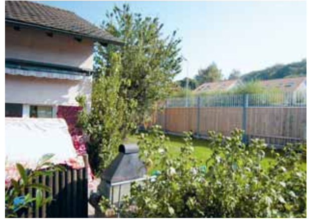
Eine gut gestaltete Lärmschutzwand – wie hier in Dietikon – muss auch von «Innen» nicht unangenehm auffallen.

wahr. Tendenziell sorgt eine Wand für eine Erhöhung der Qualität des Ausserraums.