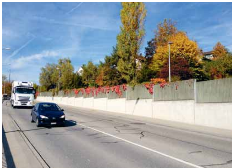
Lärmschutzwand in Eglisau: Eine solche Wand wirkt einerseits trennend, bei derart hohem Lärmpegel sind die Anwohner jedoch froh über diese Lärmschutzmassnahme.