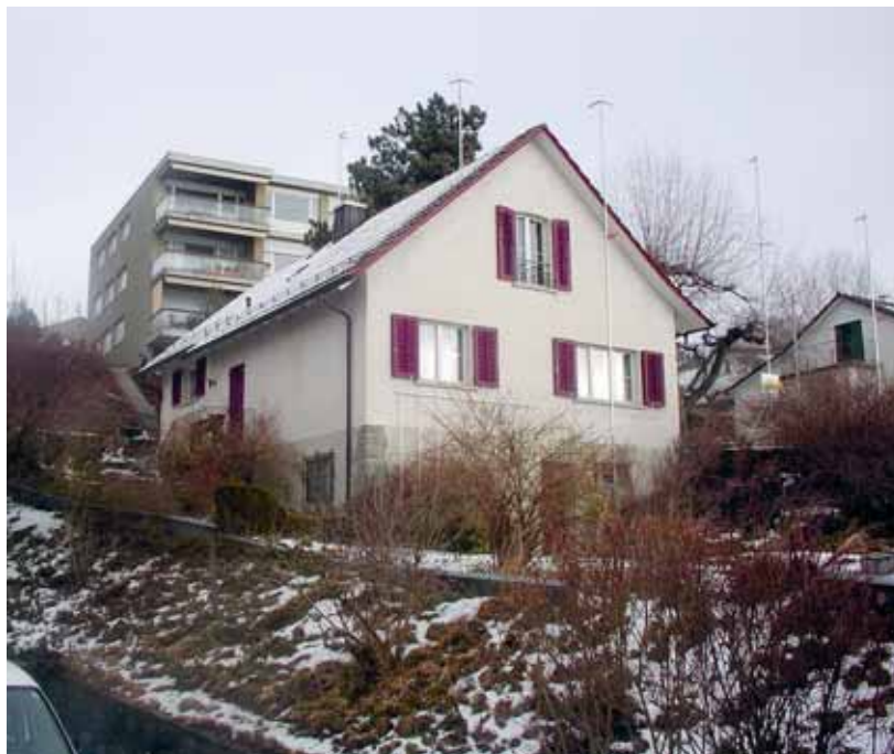
Innenentwicklung umfasst mehr als nur die bauliche Transformation des Bestands.

Bruno Widmer Witali Späth Regionalplanung Zürich und Umgebung RZU Seefeldstrasse 329, 8008 Zürich Telefon 044 387 10 43 info@rzu.ch www.rzu.ch