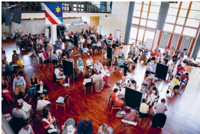
Beispiel für einen vorgelagerten Prozess: Planungswerkstatt Zollikon.

Die besprochenen Referenzen verweisen auf wichtige Aspekte für eine umfassende und situative Bestandsaufnahme. Auf die Notwendigkeit, neben den Eigentümern weitere relevante Akteure und Einflusskräfte zu identifizieren sowie für den Prozess förderliche lokale Wissensbestände zu aktivieren, stellen sie jedoch keine hinreichende