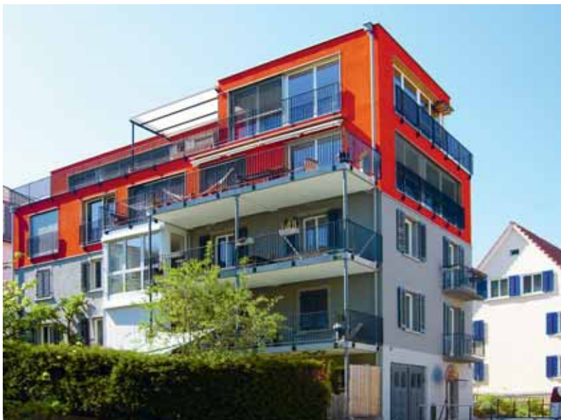
Diese Aufstockung in Thalwil zeigt, wie Bestehendes weiterentwickelt werden kann.

Projekt «Aufbau eines Netzwerks für eine kooperative Umsetzung der Innenentwicklung» 9 wird vom ARE Bund mit 175 000 Franken gefördert. Solche von Forschungsprojekten begleiteten Prozesse lassen auf interessante Erkenntnisse hoffen, auch hinsichtlich der Bandbreite an möglichen Handlungsoptionen von Behörden.