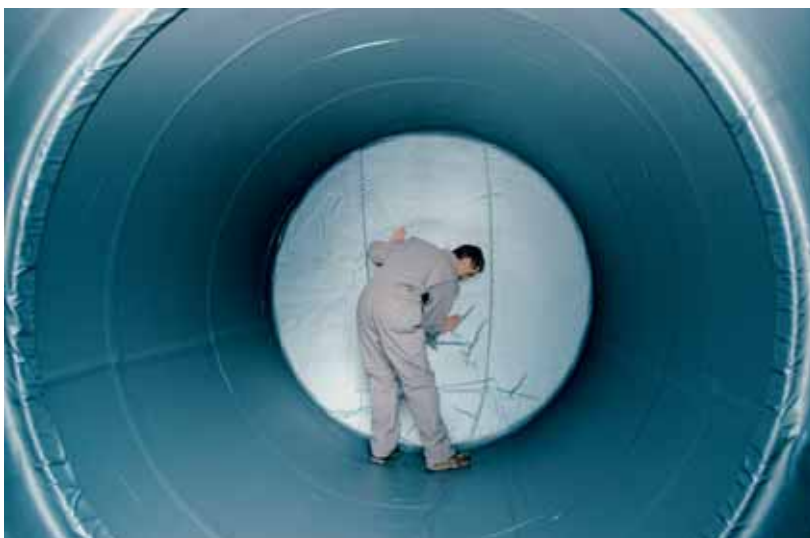
Die Innenfläche des Tanks wird mit einer PVC-Folie ausgekleidet.

Nach Entleerung und Innenreinigung wird die Tankanlage auf mögliche Leckagen geprüft sowie alle zu- und abführenden Leitungen werden abgedichtet. Sollte der leere Tank grossen mechanischen Belastungen ausgesetzt sein, zum Beispiel wenn er unterhalb einer Strasse liegt, empfiehlt es sich, den Tank mit Sand aufzufüllen. In allen anderen Fällen wird der Tank leer im Boden belassen.