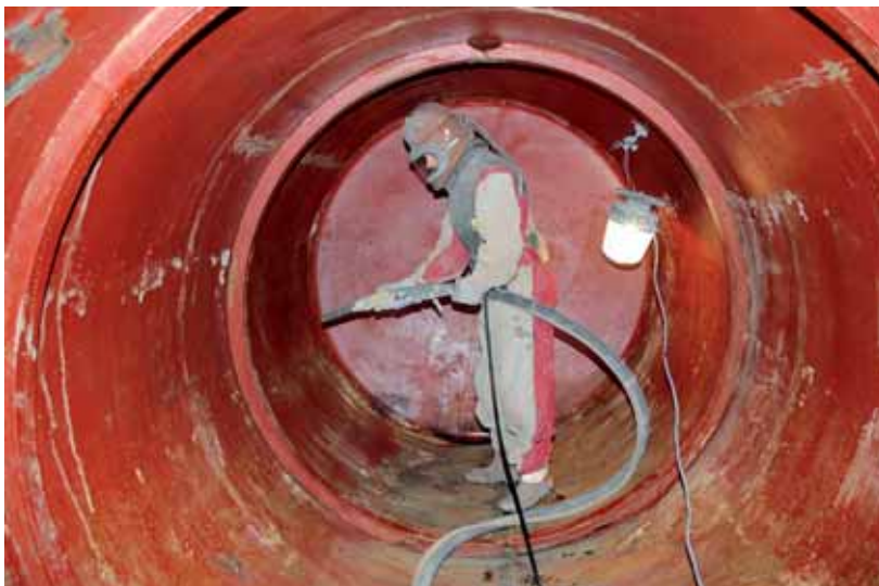
Mit einem Sandstrahler wird der zu sanierende Tank für den Schutzanstrich vorbereitet.