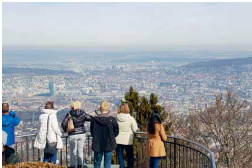
Die Entwicklungen im Kanton Zürich im Auge behalten – und einen Blick über die Kantonsgrenzen wagen. Foto: Blick vom Uetliberg auf die Stadt.

In Zusammenarbeit mit den Bundesämtern für Raumentwicklung, Statistik und Umwelt entwickelten verschiedene Kantone und Städte im Rahmen des «Cercle Indicateurs» ein Set von Indikatoren, um die Nachhaltige Entwicklung messbar zu machen. Resultat des im Jahr 2003 gestarteten Projekts ist ein überschaubares und gut gegliedertes Set an Kernindikatoren, welches laufend optimiert wird (siehe Grafik Seite 40).