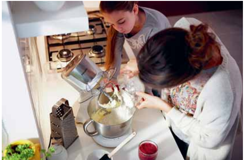
Das Bundesamt für Statistik befragte die Bevölkerung zum zweiten Mal zu ihrem Umweltverhalten, zum Beispiel dem Energiebewusstsein, sowie zu ihrer Wahrnehmung der Umweltqualität.

Details und genaue Zahlen: www.statistik.admin.ch → Themen → 02 - Raum, Umwelt → Umwelt und Ressourcen → Wahrnehmung der Umwelt durch die Bevölkerung