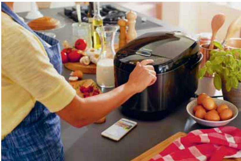
Mehr Menschen war 2015 beim Kauf kleinerer Elektrogeräte der Stromverbrauch wichtig.

Die Umweltqualität weltweit wurde weniger positiv bewertet als noch vor vier Jahren und sank von 23 Prozent der Bevölkerung, die diese als sehr gut oder eher gut beurteilten, auf 20 Prozent.