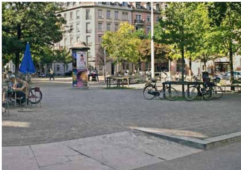
Idaplatz Zürich. Kiesflächen werden visuell wenig mit Verkehr in Verbindung gebracht. Akustisch reflektieren sie den Verkehrslärm weniger stark als versiegelte Asphaltflächen, und die eigenen Schritte sind hörbar. Sich selbst hören zu können, ist ein wichtiges akustisches Qualitätsmerkmal im öffentlichen Raum.

Thomas Gastberger Fachstelle Lärmschutz Tiefbauamt Baudirektion Kanton Zürich Postfach, 8090 Zürich Telefon 043 259 55 23 thomas.gastberger@bd.zh.ch www.laerm.zh.ch