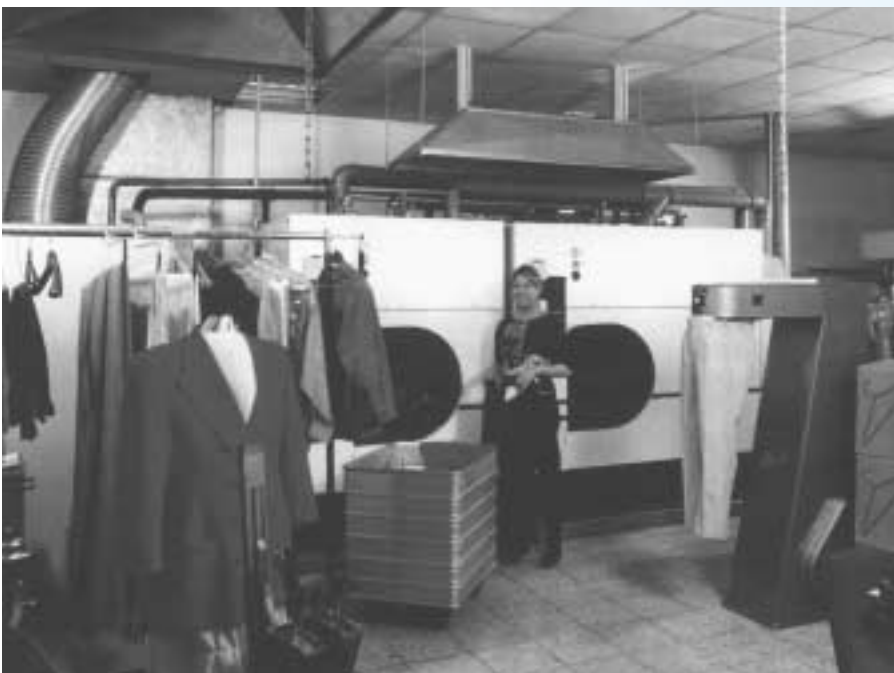
Textilreinigungsbetriebe: Immer weniger chlorierte Reinigungsmittel im Einsatz.

Redaktionelle Verantwortung für diesen Beitrag: Amt für technische Anlagen und Lufthygiene – ATAL Abteilung Luftreinhaltung in Industrie und Gewerbe Beat Hürlimann 8090 Zürich Telefon 01 259 43 45