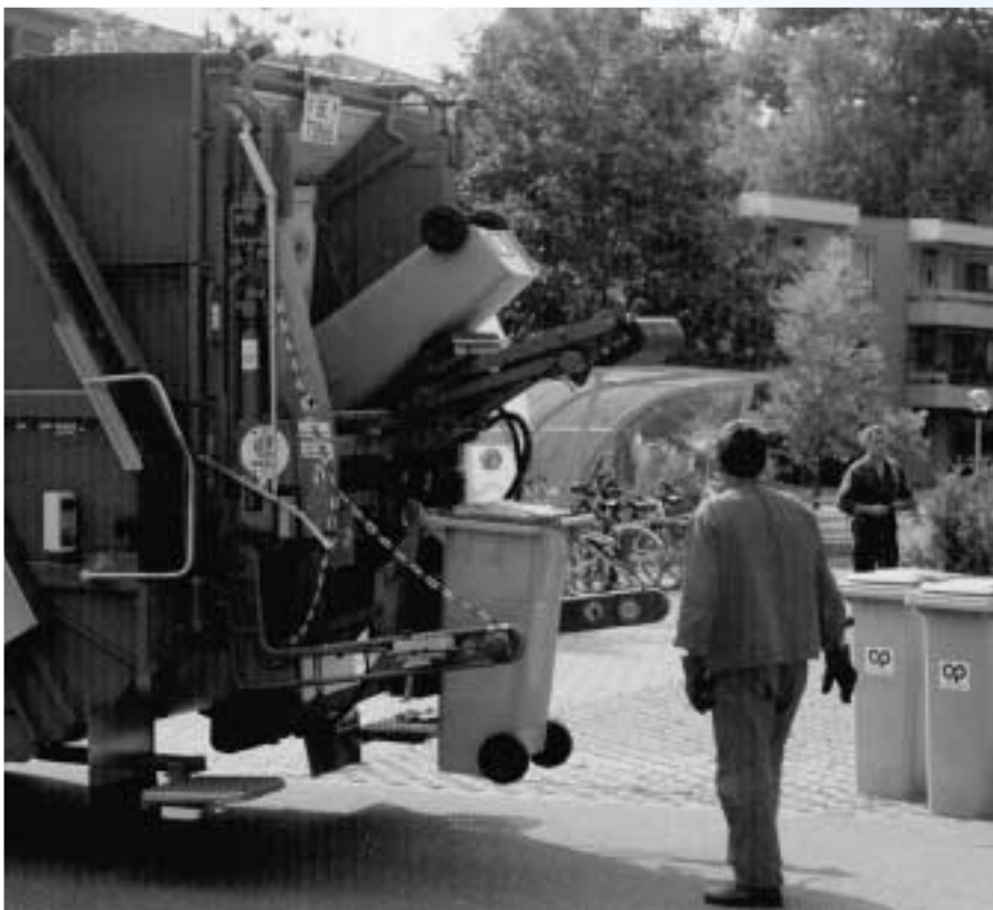
Die nach einer zusätzlichen Korrektur (Abzug der Betriebsabfälle) von den Sammeldiensten der Gemeinden separat erfassten brennbaren Siedlungsabfälle (Hauskehricht) sind nach wie vor rückläufig.

In Zusammenarbeit mit dem Statistischen Amt: Dr. Felix Bosshard