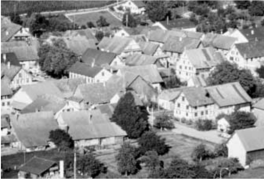
Die lokale nachhaltige Entwicklung braucht nicht nur engagierte Bürgerinnen und Bürger, sondern auch politische Instanzen und Behörden mit Ausdauer und Beharrlichkeit.