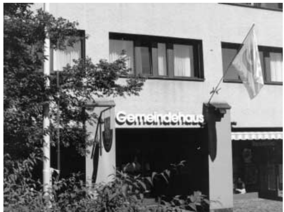
Die Lokalbehörden spielen als Regierungsbehörden, die den Menschen am nächsten stehen, eine entscheidende Rolle für eine nachhaltige Entwicklung. Im Bild: Gemeindehaus in Zumikon.

Diese Forderung gilt für alle Unterzeichnerstaaten der Welt mit ihrem sehr unterschiedlichen Stand der gesellschaftlichen, wirtschaftlichen und politischen Entwicklung. In der Folge müssen die Vorgaben auf die konkreten, länderspezifischen Verhältnisse, also auch die schweizerischen, übersetzt werden. Klar ist, dass im Kapitel 28 die Lokalbehörden aufgerufen sind, die Lokale Agenda 21 auszuarbeiten und nicht irgendwelche Bürgergruppen. Die Lokalbehörden haben jedoch die von