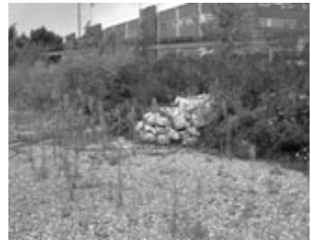
Die Ruderalflächen zwischen den extensiv genutzten Geleisen beherbergen zahlreiche Tierarten der roten Listen.

Wiederherstellungs- oder Ersatzmassnahmen, wie sie in Zürich, Graubünden und Bern durchgeführt wurden, sind erforderlich, sobald ein Eingriff besonders schutzwürdige Lebensräume tangiert, un-