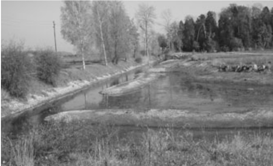
Nach dem Bau der Umfahrungsstrasse T10, im Jahr 2001, bot der aufgewertete Altlauf der Aare neuen, wertvollen Lebensraum.