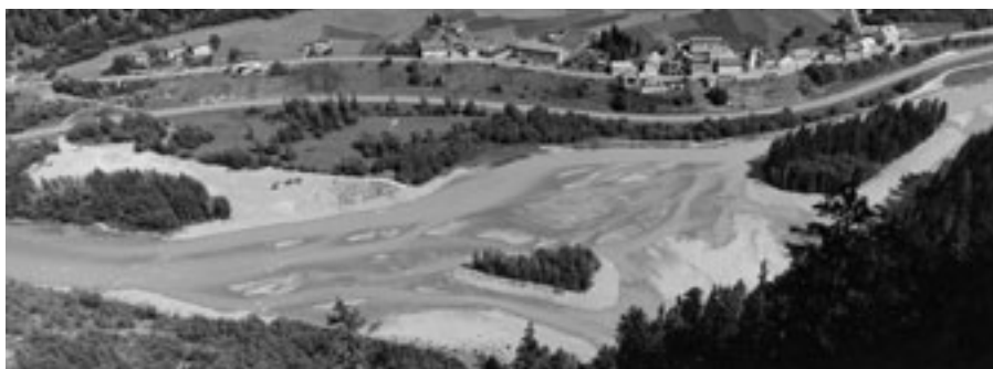
Eine Ersatzmassnahme kann der Natur Raum verschaffen: Das Auenbiotop vor der Renaturierung des Inns (oben) und nachher (unten).