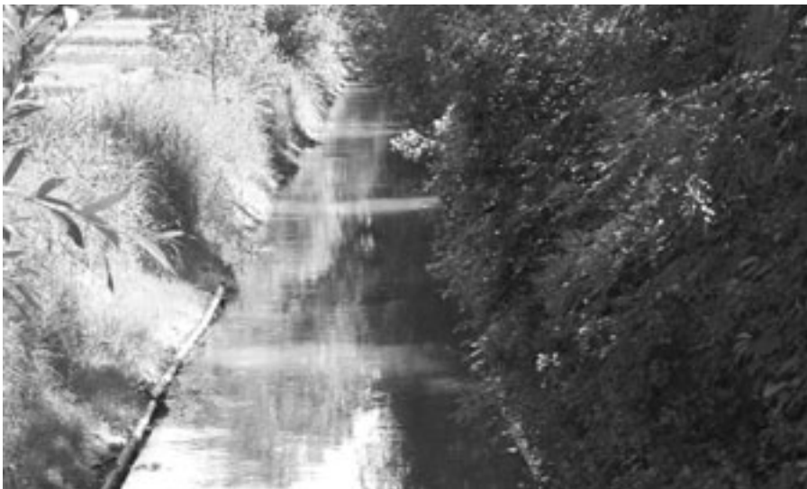
Im Jahr zuvor war der Aarekanal nicht nur sanierungsbedürftig, der gerade Kanal hatte auch nur geringen ökologischen Wert.