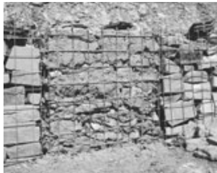
Lehmwand zwischen Steinkörben: Nisthilfe für Wildbienen und Schlupflöcher für Eidechsen.

Auch im Kanton Zürich gibt es ein anschauliches Beispiel: Beim Ausbau des Bahnhofs Zürich war es unumgänglich, schutzwürdige Lebensräume zu zerstören. Aufgrund ökologischer Kriterien wurde