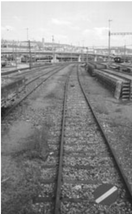
Umbau des Bahnknotens Zürich. So unwirtlich die Gleisanlagen wirken, sie können in nächster Nähe Lebensraum für Tiere und Pflanzen bieten.