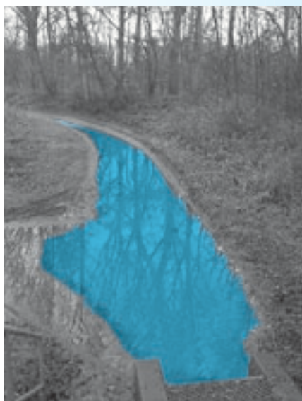
Farbstoffe können ein Gewässer über weite Strecken hässlich aussehen lassen.

Eine andere Möglichkeit ist, einen unbedenklichen Stoff wie Sägemehl oder Konfetti in das Entwässerungssystem zu streuen. Im Folgeschacht sind solche schwimmenden Partikel sehr leicht erkennbar und führen im Schmutzwassersystem zu keiner Beeinträchtigung der Abwasseranlagen. Ausserdem ist Sägemehl in einem Gewässer absolut unbedenklich. Auf diese einfache und effiziente Weise sind Gemeinden, Ingenieure oder auch Einsatzkräfte in der Lage, die