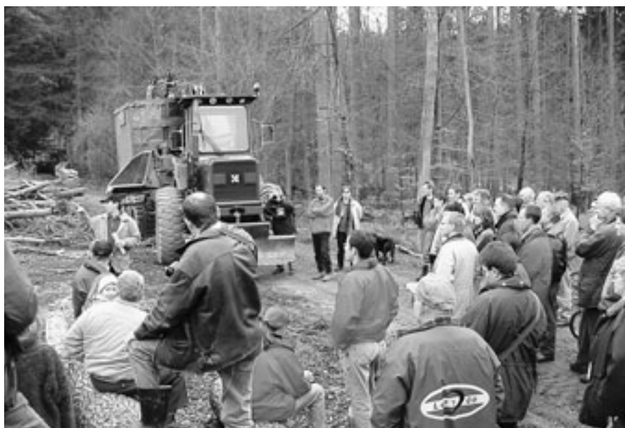
Immer mehr private und öffentliche Haushalte verwenden in Illnau-Effretikon Holz für die Produktion von Wärme und Warmwasser. Das Holz stammt aus dem nahen Wald, wie hier im Rahmen einer Veranstaltung der Bevölkerung gezeigt wird.