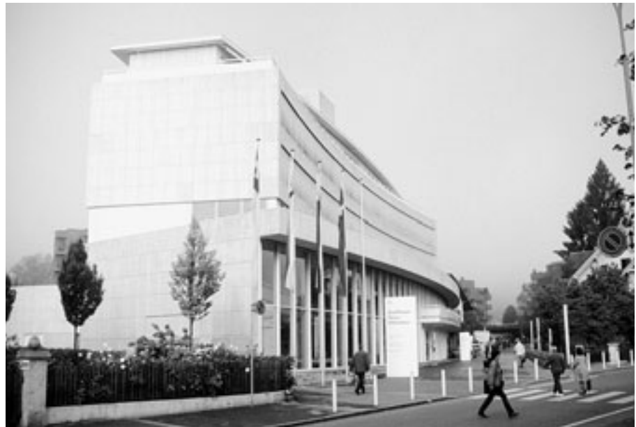
Illnau-Effretikon hat im Dialog zwischen Behörden, Parteien, Kirchen, Schulen, Vereinen und dem Gewerbe von 1999–2001 eine Lokale Agenda 21 erarbeitet. Die Gemeinde will sich für die Bevölkerung klar erkennbar in den fünf Handlungsfeldern Energie, Kultur, Markt, Natur und Wohnen entwickeln.

keitscheck einsteigen», oben). Oder die Gemeindeverwaltung möchte zuerst ihre Handlungsfelder einer Nachhaltigkeitsanalyse unterziehen, wie dies im Kanton Baselland gemacht wird. Oder aber: Es geht zunächst um das Lindern eines Notstands, das Lösen einer Blockade oder um das Planen eines bedeutenden Projekts. Bei solchen Herausforderungen ist die Bereitschaft für neue Vorgehensweisen meistens rasch vorhanden, wenn sich die Beteiligten bewusst werden, dass bisherige Fähigkeiten und Routinen nicht mehr ausreichen.