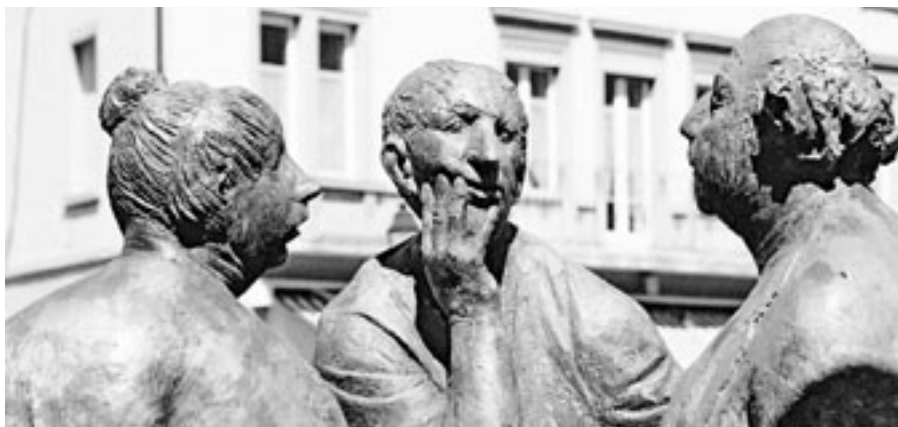
Unter Führung eines neutralen Verhandlungsleiters können Betroffene im Rahmen des Verhandlungsverfahrens effizient und eigenverantwortlich eine faire Lösung zur Kostenverteilung finden.