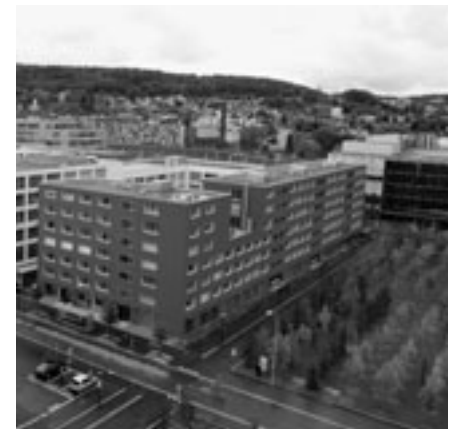
Die Standortdokumentation ist eine wesentliche Grundlage für sachliche Verhandlungen.

Liegt die von den Parteien unterzeichnete privatrechtliche Vereinbarung vor, wird das Kostenverteilungsverfahren mit einer Verfügung abgeschlossen. Darin wird die Regelung in Bezug auf die Verteilung der Kosten zur Kenntnis genommen.