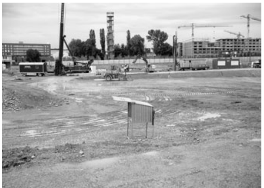
Erst wenn die Kosten angefallen sind, tritt das AWEL auf ein Kostenverteilungsgesuch ein.

bewirken. Dafür hat die am 1. November 2006 in Kraft getretene USG-Revision eine gesetzliche Grundlage geschaffen. In der Regel werden zwei Drittel der Mehrkosten auf die Verursacher und die früheren Inhaber verteilt. Für zivilrechtliche Ansprüche gemäss Art. 32bbis USG leistet der Bund keine Abgeltungen, zudem besteht kein Anspruch auf Ausfallkosten.