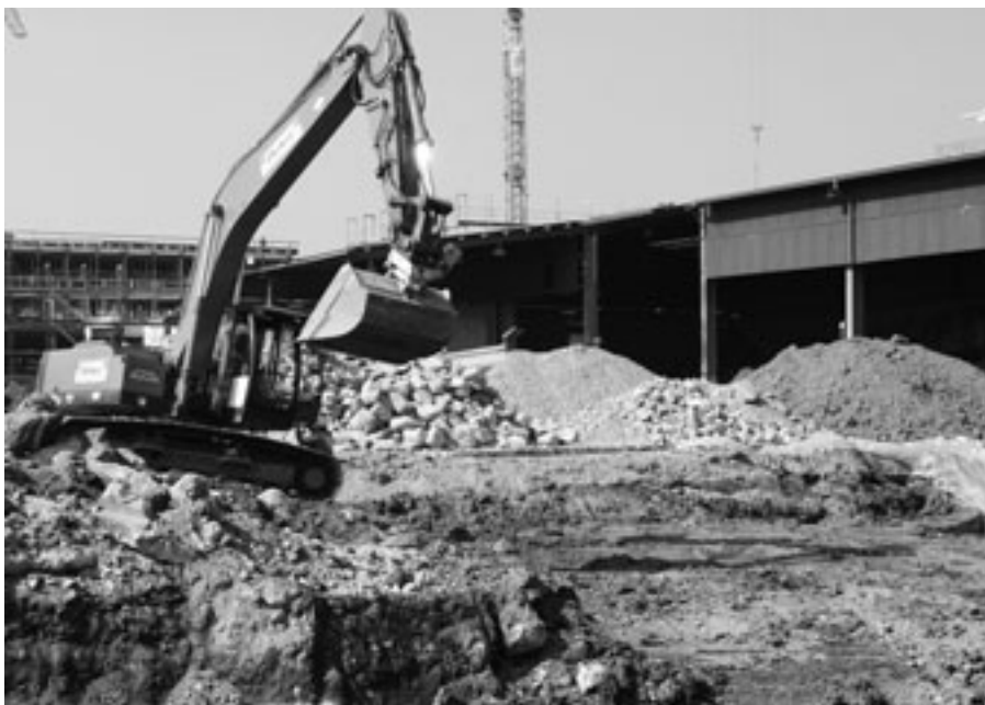
Nicht immer ist derjenige, der altlastenrechtliche Massnahmen durchführen und damit vorfinanzieren muss, auch derjenige, der sie definitiv bezahlen muss.

Mit der am 1. Juli 1997 in Kraft getretenen Revision des USG wurde in Art. 32d USG das Institut der Kostenverteilung eingeführt. Gesetzlich war zunächst nur die Verteilung der angefallenen Sanierungskosten vorgesehen. Im Urteil vom 3. Mai 2000 (publiziert in URP 2000, S. 590 ff.) weitete das Bundesgericht jedoch das Anwendungsfeld dieser Bestimmung aus. Gestützt auf die allgemeine Bestimmung zum Verursacherprinzip (Art. 2 USG) erklärte es auch eine Verteilung der Untersuchungs-, bzw. Überwachungskosten auf die Verursacher in Analogie zu Art. 32d USG als gerechtfertigt. Die am 1. November 2006 in Kraft getretene USG-Revision setzte diese Praxis ins Gesetz um.