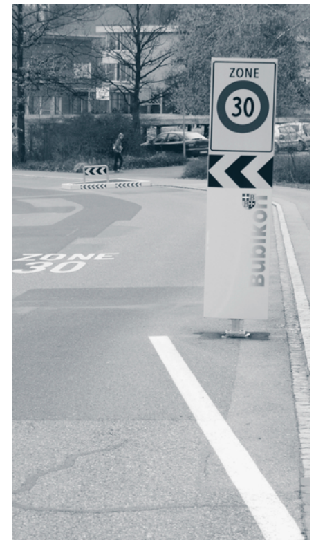
Die Einführung von Tempo 30 in den Quartieren erfolgt jeweils nach einer sorgfältigen Information der Anwohnerinnen und Anwohner.

In Bubikon bleibt die Erkenntnis, dass Nachhaltige Entwicklung nichts anderes ist als langfristige, verantwortungsvolle Politik.