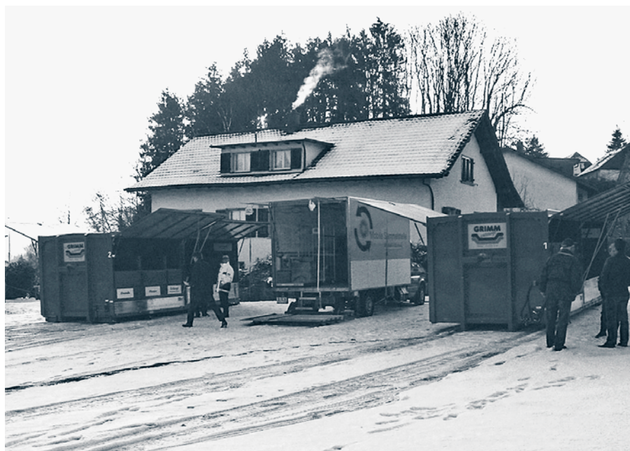
Zur Förderung von Abfalltrennung und -recycling bietet Bubikon gemeinsam mit Dürnten die erste mobile Multisammelstelle im Kanton Zürich an.