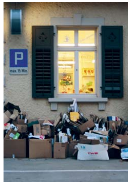
Ein Lebensmittelladen nutzt die monatliche Kartonsammlung der Gemeinde, welche durch die Abfall-Grundgebühr finanziert wird.