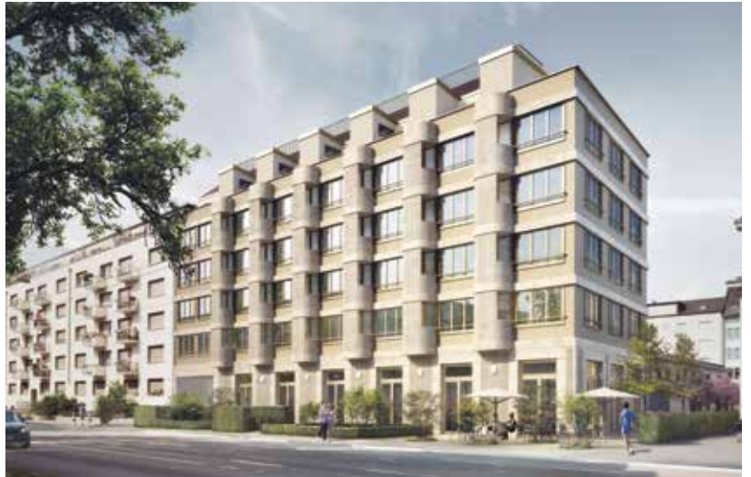
Ein vom Kanton gefördertes Pilotprojekt mit der Hochleistungswärmedämmung Aerogel an der Hohlstrasse in Zürich.