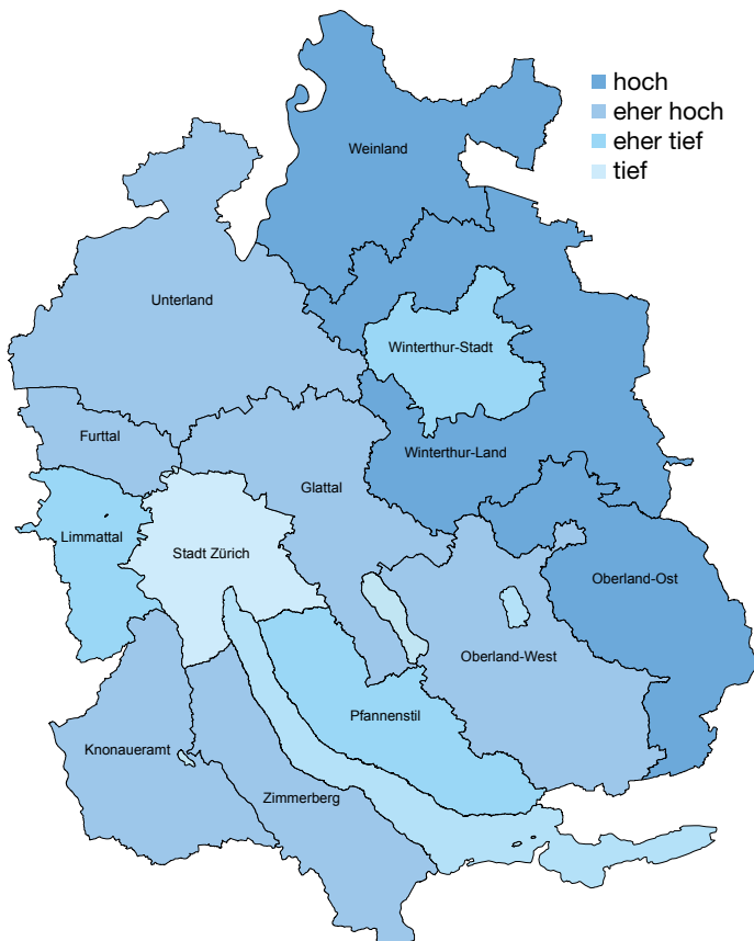
Jährlicher Pro-Kopf-CO 2 -Ausstoss nach Mikrozensus.

struktur ist daher weiterhin auf das Angebot des öffentlichen Verkehrs auszurichten und der Bevölkerungszuwachs soll sich, übereinstimmend mit dem kantonalen Raumordnungskonzept, noch stärker auf die urbanen Gebiete konzentrieren. Für die verbleibende Verkehrsnachfrage sollen möglichst effiziente Fahrzeuge (im realen Betrieb) eingesetzt werden – zunehmend auch Modelle, die ohne fossile Treibstoffe fahren. Anforderungen an Fahrzeuge ist aber Sache des Bundes.