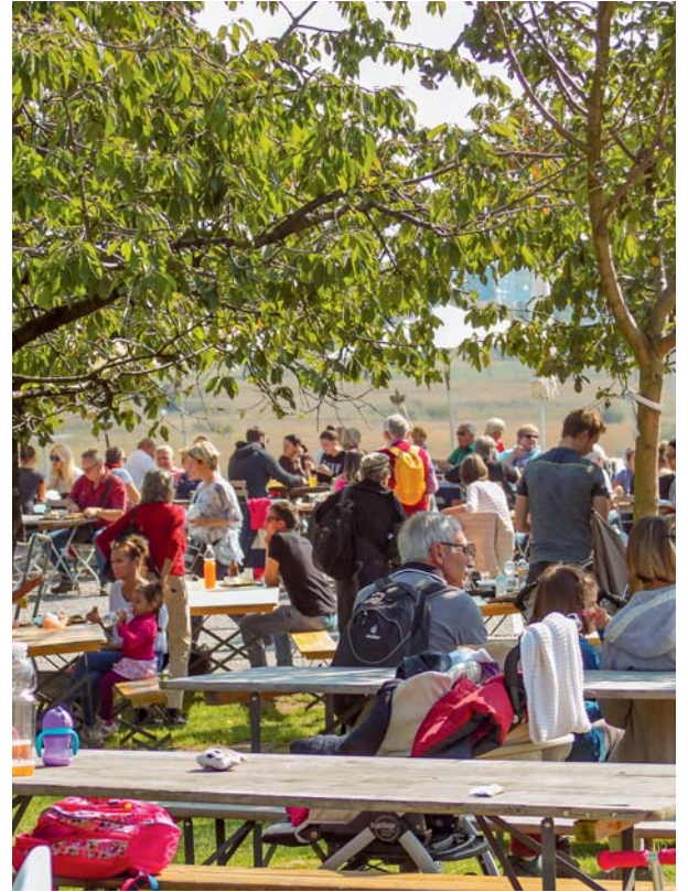
Seegräben liegt idyllisch am Pfäffikersee und zieht Erholungssuchende an. Der Erlebnishof lockt noch mehr Menschen hierher, so dass ein Verkehrskonzept nötig wurde.