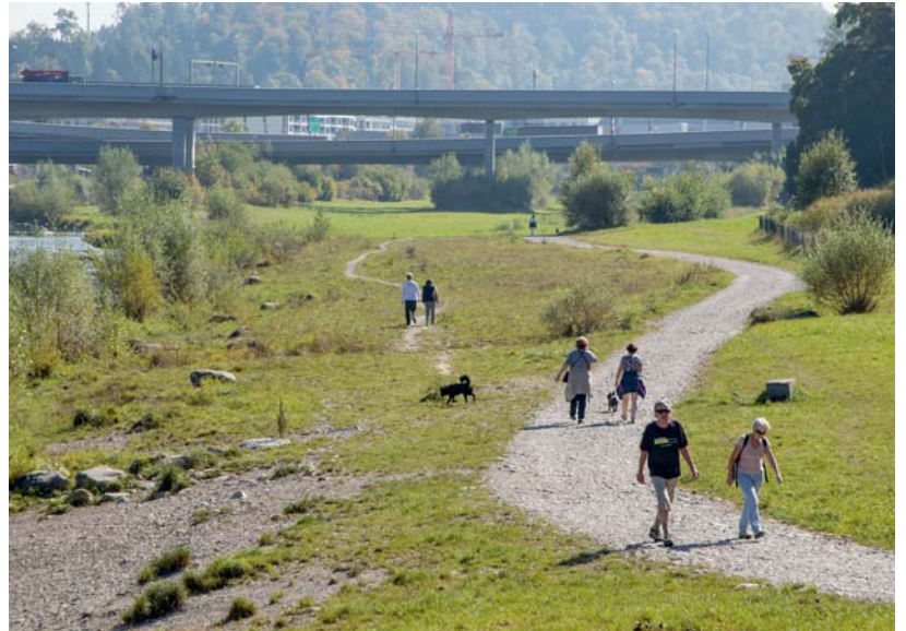
Freiräume zur Alltagserholung in der Nähe des Wohnumfelds sind wichtig für die Bevölkerung. Aus raumplanerischer Sicht reduzieren sie zudem das Verkehrsaufkommen und damit den Ressourcenverbrauch (Im Bild: Allmend Brunau, Zürich).

→ Artikel «Kanti Uetikon – Provisorium mit Vorbildfunktion», Seite 21 → Veranstaltungen, Seite 45, 47