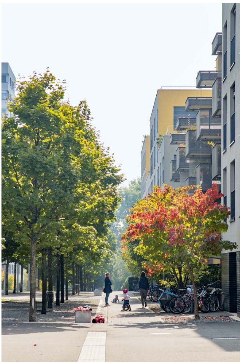
In dicht besiedelten Gebieten braucht es Erholungsräume, die für die alltägliche Erholung zur Verfügung stehen. Dabei muss es sich nicht zwingend um reine Grünräume handeln.

Im urbanen Raum gibt es jedoch auch Beispiele von sanfteren Formen der Erholung am Wasser. Die Stadt Uster hat für die Neugestaltung des Parks am Aabach eine Gebietsentwicklung durchgeführt, die als wegweisend in diesem Bereich gelten kann. Solche Planungen mit Fokus auf die Alltags-erholung sind zu unterstützen, da sie aufzeigen, wie sich Schutz und Nutzung durch gute Planung sinnvoll miteinander verbinden lassen.