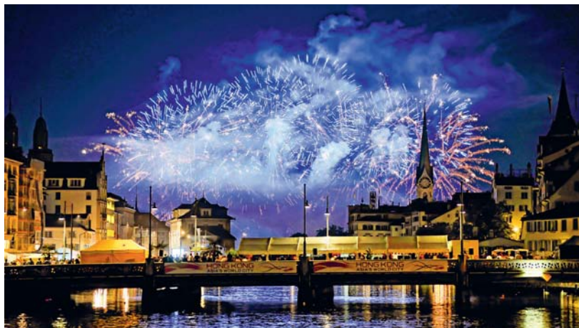
Selbst schönes Feuerwerk kann lästig sein und der Gesundheit schaden.

Hauptsächlich am 1. August und in der Silvesternacht, aber zunehmend auch aus privatem Anlass feiert die Schweizer Bevölkerung mit farbigen Luftbildern und Knallerei. Dabei werden jedes Jahr unglaubliche zwei Millionen Kilo Sprengstoff in die Luft gejagt. Der Kreativität und Ablaufoptimierung sind keine Grenzen gesetzt. In zunehmendem Mass kommen regelrechte Miniatur-Stalinorgeln zum Einsatz, mit denen in schneller Folge eine ganze Batterie an Feuerwerksraketen abgefeuert werden können.