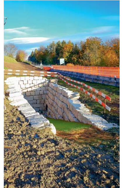
Der neu erstellte Kleintierdurchgang Heuberg ermöglicht Füchsen, Marderartigen und anderen Kleintieren ohne Gefährdung die A52 zu unterqueren.

Der Zugang zur künftigen Unterführung Neuhaus ist eine ordentliche Baugrube: rund sechs Meter tief und acht Meter breit. Hunderte Kubikmeter Erde wurden dafür vom kantonalen Tiefbauamt per Bagger ausgeschachtet. Dann wurden dicke Rohre unter der Fahrbahn der Forchautostrasse A52 durchgetrieben. Jedes mit einem Durchmesser von 1,6 Metern. Diese wurden miteinander verschweisst, bis nach gut 30 Metern die andere Seite erreicht wurde. Die Baugrube wurde mit einer Blocksteinmauer befestigt. Jetzt ist nach eineinhalb Wochen Bauzeit der Weg frei.