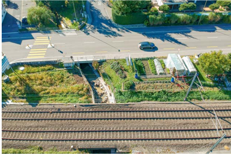
Wie soll ein Wildtier hier an der Grenze Horgen/Wädenswil unbeschadet Hauptstrasse, Bahngleise und Seeuferweg überwinden? Hier war eine Querungshilfe dringend nötig. Von der heutigen Ausgestaltung profitieren neben Landbewohnern auch Tiere, die im Meilibach leben.