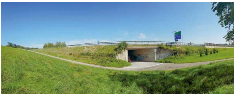
Naturbelag, zusätzliche Büsche und mehr nutzbare Böschung ermöglichen Wildtieren wie Reh, Marderartigen und anderen Kleintieren bei der Unterführung Hasenacker auf die andere Seite der A52 zu gelangen.