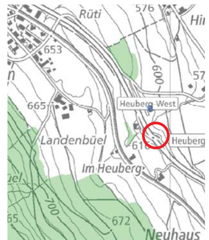
Der Kleintierdurchgang Heuberg verbindet zwei Naturräume.

Es ist Auftrag des Kantons, isolierte Lebensräume wieder zusammenzuführen, um die Biodiversität zu erhalten. Der kantonale Richtplan hält mit dem Eintrag «geplante Landschaftsverbindung» fest, wo «Fragmentierung und Isolierung von Erholungsräumen für die Bevölkerung und Lebensräumen für die Wildtiere