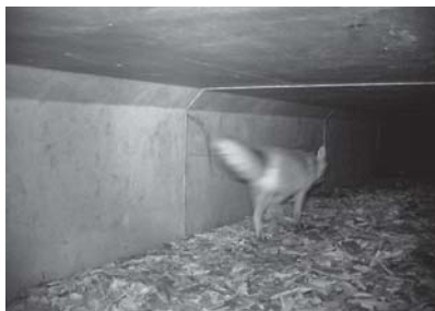
Kleintiere wie dieser Fuchs durchqueren Kleintierdurchgänge.

Für die Projektierung und Realisierung ist das kantonale Tiefbauamt verantwortlich. Für diejenigen Massnahmen